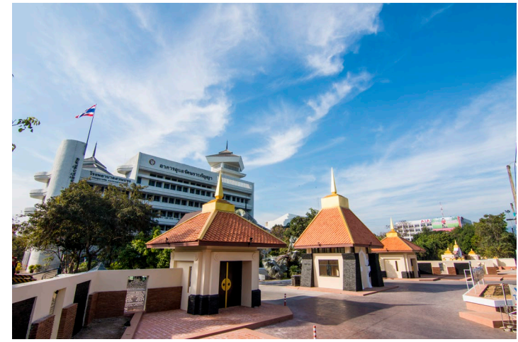
ปรับปรุง 1 ต.ค.2565